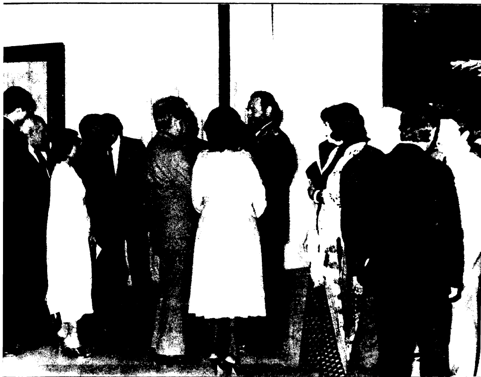
لقاء مع كاسترو على هامش مؤتمر الحزب الشيوعي الكوبي في هافانا